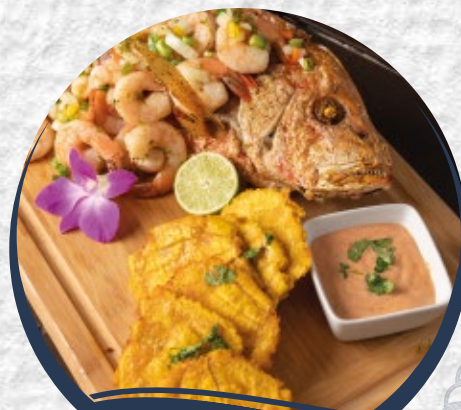
LANGOSTA ENTERA POR PESO

Pescado entero relleno de paella o mariscos mixtos/ Whole fish stuffed with paella or seafood mix