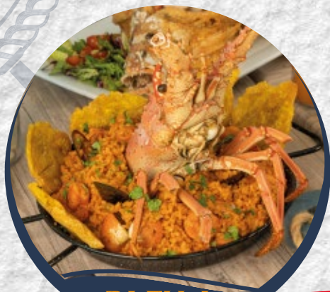
PAELLA MARISCOS $60

Paella de mariscos servida para dos personas/ seafood paella served for two