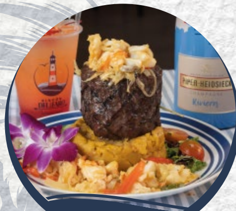
MAR Y TIERRA $50

Churrasco a la parrilla relleno de mariscos mixtos en nuestra salsa de la casa/ Skirt steak stuffed with seafood mix with house sauce