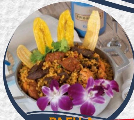
PAELLA CRIOLLA $50

Paella de mariscos servida para dos personas/ seafood paella served for two