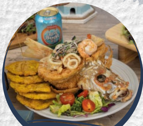
PESCADO RELLENO $60

Churrasco a la parrilla relleno de langosta/ Skirt steak stuffed with lobster