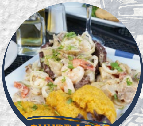
CHURRASCO EL FARO $55

Paella de carne servida para dos personas/ Meat paella served for two